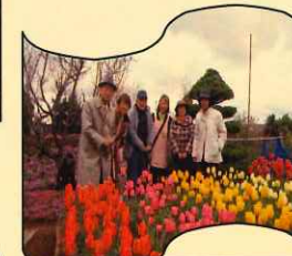
チューリップ を見学に