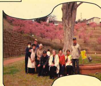
印旛高跡へ河津桜を見る