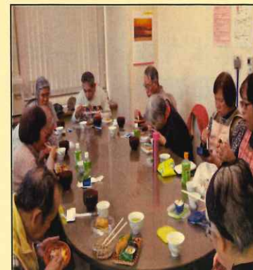
楽しいおやつ時間