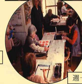
週一度のお習字の日