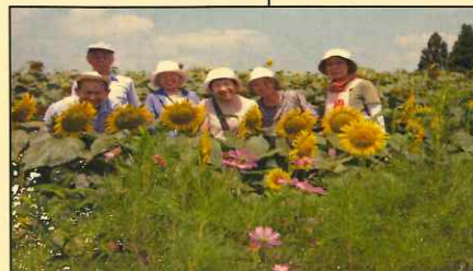
あけぼの山公園のひまわり