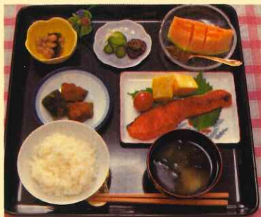
手作りで 家庭の味