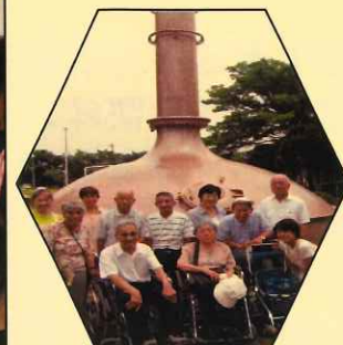
恒例ビール工場見学