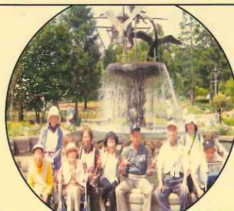
アンゼルセン公園に遊ぶ