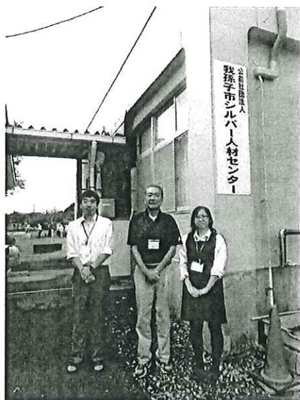
「シルバーきずな」のスタッフ

1回当たり（60分を限度）の利用者負担 1割負担の方は140円 2割負担の方は280円