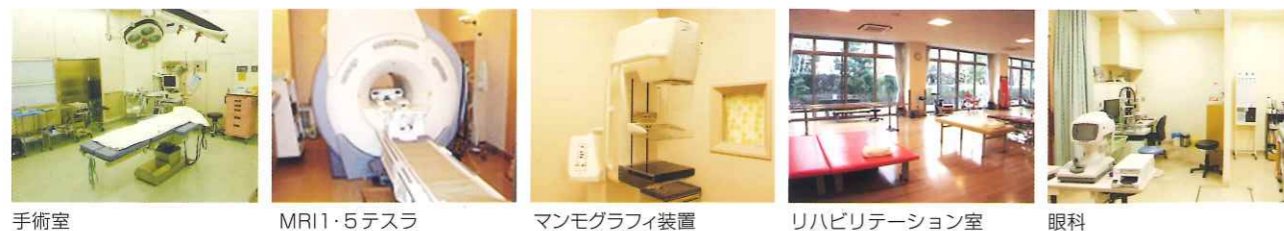
手術室 MRI・CT テスラ マンモグラフィ装置 リハビリテーション室 眼科