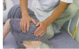
③ マッサージで疲労回復