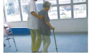
④ 軽くなった身体で歩行訓練