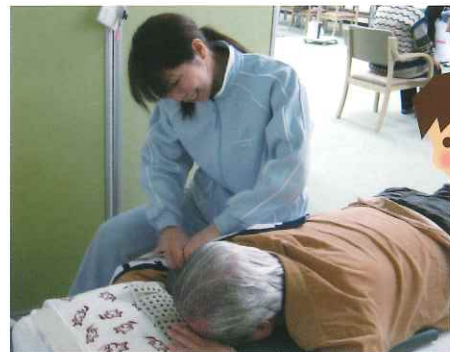
● そんな方にはしっかりとソフトな全身マッサージ!!