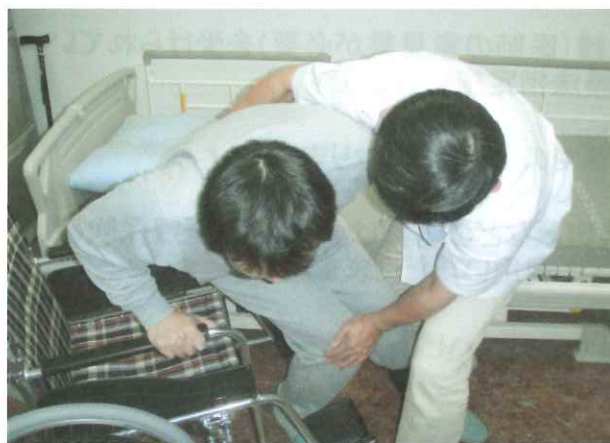
自力で車椅子に移乗できるようにする訓練