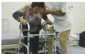
③ 歩行器や車椅子で歩行訓練