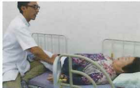
① 固縮した筋肉をマッサージ