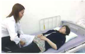
① 6大関節周辺のマッサージ