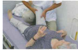
① 疼痛部分はマッサージで緩和