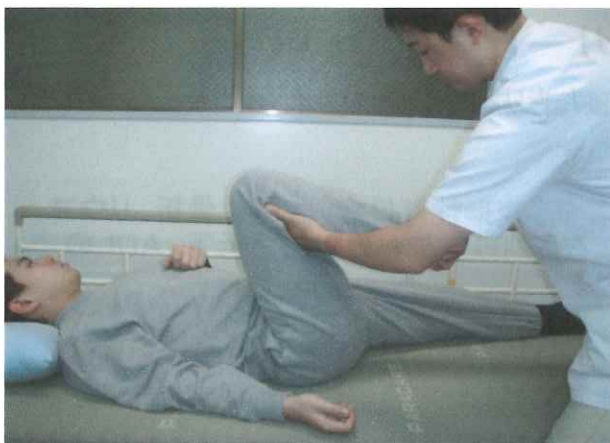
廃用症候群による筋力低下に対する自動介助運動での筋力強化訓練

ホームページで施術の様子を動画にてご覧いただけます URL http://www.recovery-mm.com/