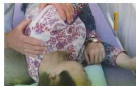
④ 合間にマッサージで疲労回復