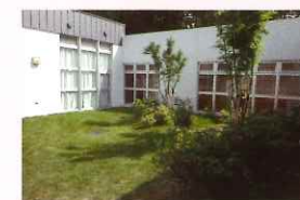
精神科急性期治療病棟 中庭の様子

精神症状が悪化し、集中した治療が必要な方が入院する病棟です。3ヶ月以内の早期退院、社会復帰を目指します。