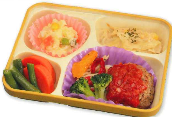
ハンバーグトマトソース

たんぱく質の摂取計算が必要な方向けのお弁当です。病院のメタボ検診、生活習慣病外来などで栄養指導を受けている方、透析クリニックに通院されている方、食事制限されていて特別食が必要な方に。