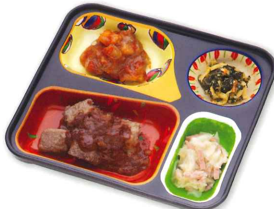
牛肉のデミグラスソースかけ弁当