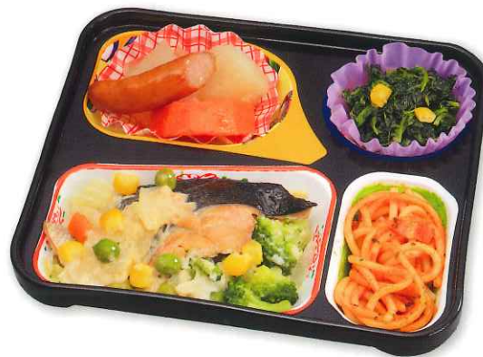
鮭のホワイトシチュー

●カロリー 234kcal ●タンパク質 15.5g ●脂質 10.7g ●炭水化物 24.0g ●ナトリウム 877mg ●食塩相当量 2.2g