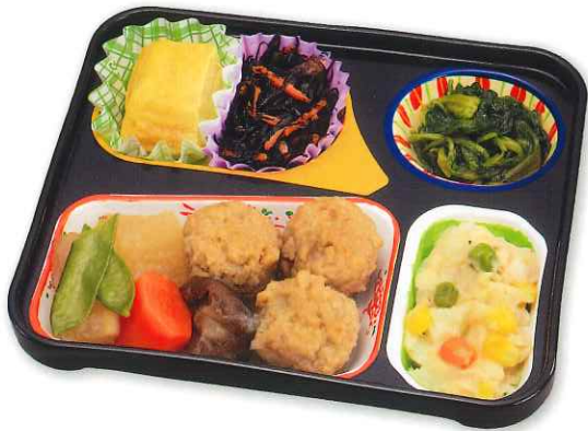
大根とつくねの煮物

カロリーをバラつきの少ない一定の値に調整し、栄養バランスの良いカロリー計算が必要な方に適したお弁当です。ダイエットや食事療法も無理なく続けられます。