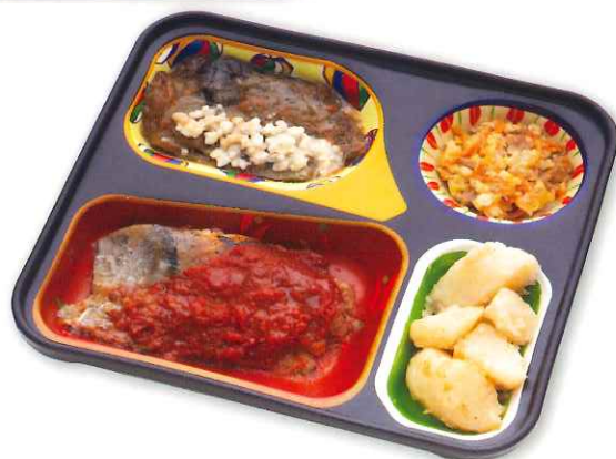
アジのトマトソース弁当

食べ物を噛むことが困難な方に適したお弁当です。食材の形、色、味、栄養はそのままに、野菜や肉、魚なども歯茎や舌で容易につぶせるやわらかさに仕上げた食事支援食です。