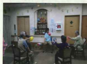
デイサービス 機能訓練

ご自宅での生活の目標を設定し、その目標に向け、スタッフが一人おひとりに合わせて訓練を行ない、お身体状況の維持・向上に努めます。