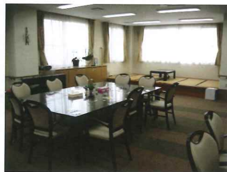
デイサービス 食堂兼機能訓練室