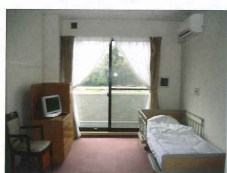
ショートステイ居室 個室