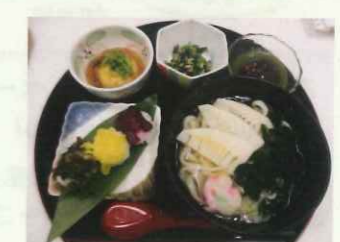
プレミアムランチ