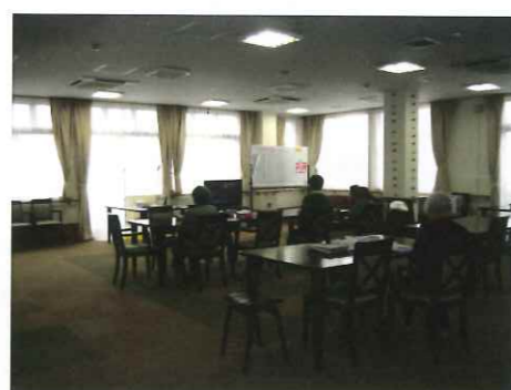
ショートステイ 食堂兼機能訓練室