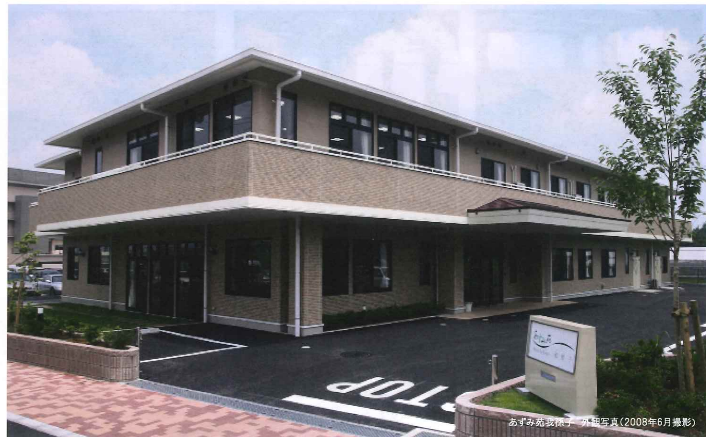
あずみ苑我孫子 外観写真(2008年6月撮影)