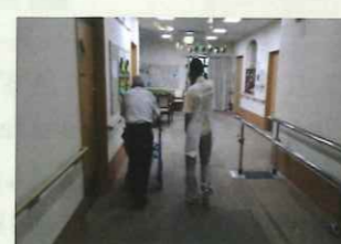
デイサービス 機能訓練