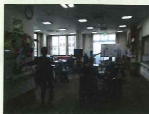
ショートステイ 朝の体操