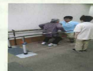
ショートステイ 機能訓練