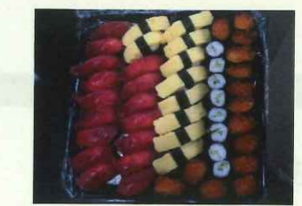
食事レク(お寿司バイキング)