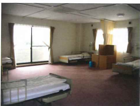
ショートステイ居室 多床室(4人部屋)