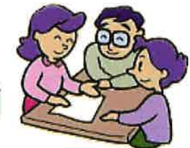
ご家族等への介護支援・相談