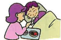
食事（栄養）指導管理 排泄の介助・管理