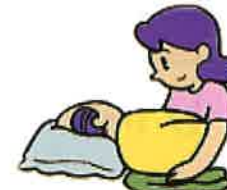
床ずれの予防と処置